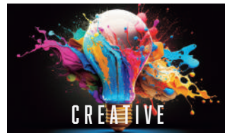
クリエイティブ事業

各スポーツのリーグ・クラブのお悩みを、代理店として解決へ導きます。長年にわたりスポーツ業界で戦い抜いてきたメンバーの持つネットワークで、人と人を繋ぎ、新たな「輪」を生み出します。