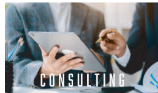
スポーツ コンサルティング事業

各スポーツのリーグ・クラブに対して、営業・クリエイティブ・法務などそれぞれの分野のエキスパートがコンサルティングを行います。新しい価値の創出や、それに伴ったPR、各種手続きなど多方面でサポート。