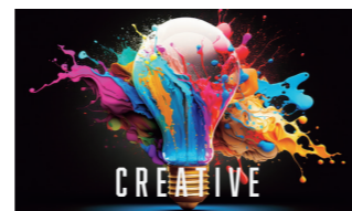
クリエイティブ事業

各スポーツのリーグ・クラブのお悩みを、代理店として解決へ導きます。長年にわたるスポーツ業界で戦い抜いてきたメンバーの持つネットワークで、人と人を繋ぎ、新たな「輪」を生み出します。