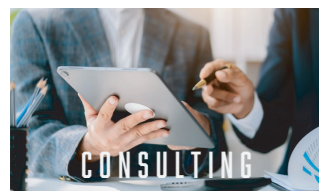
スポーツ コンサルティング事業

各スポーツのリーグ・クラブに対して、営業・クリエイティブ・法務などそれぞれの分野のエキスパートがコンサルティングを行います。新しい価値の創出や、それに伴ったPR、各種手続きなど多方面でサポート。